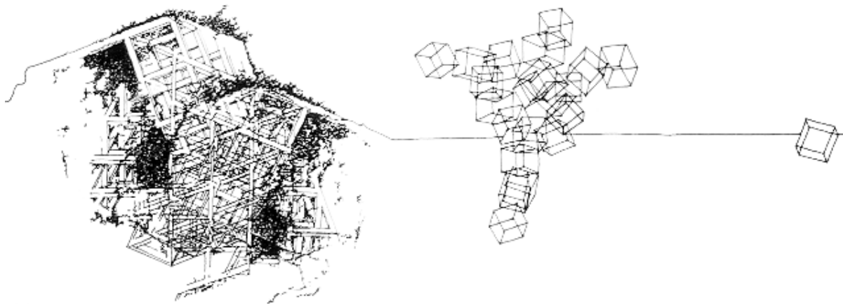
تصویر ۲: مطالعه لطیف عبدالملک بر روی شکستن سیال مکعب یا واسازی «کعبه» (Kahera 2002, 141)