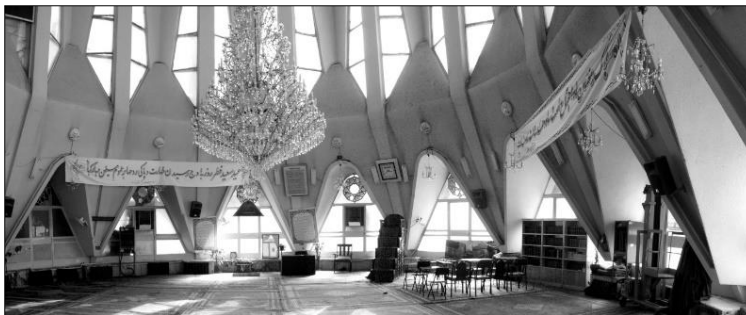
تصاویر ۵ و ۶: فضای داخلی و کالبد بیرونی مسجد الجواد میدان هفت تیر تهران Figs. 5 & 6: The interior and Exterior of Al-Jawad Mosque in Haft Tir Square, Tehran