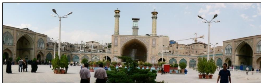
تصاویر ۱ و ۲: فضای داخلی و صحن اصلی مسجد امام تهران