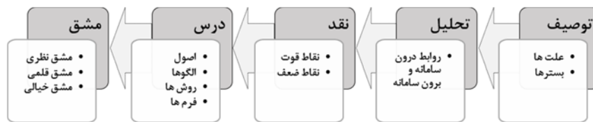
تصویر ۲: نمودار مسیر خواندن معماری