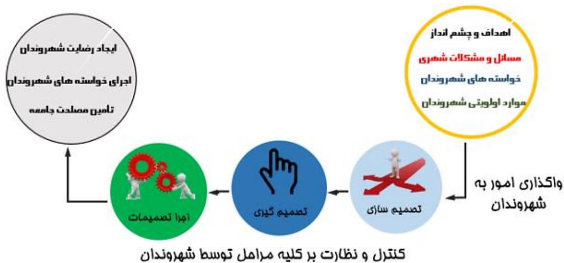
تصویر ۱: ساختار و الگوی مشارکت در مدیریت شهری اسلامی مفهومی و اولیه