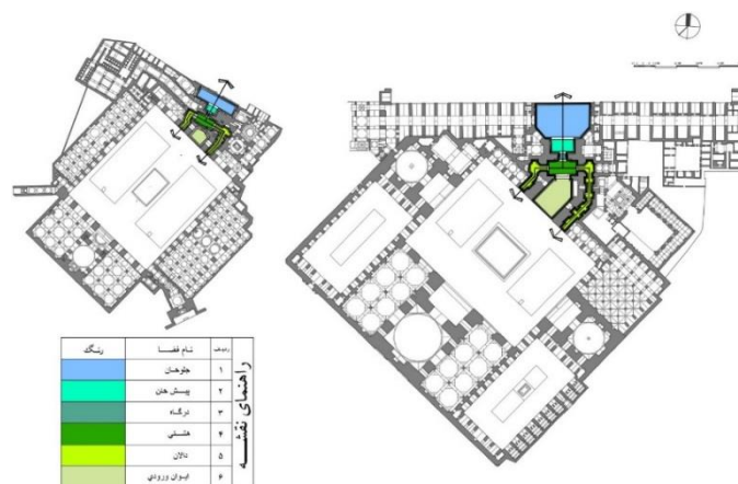
تصویر ۱: فضای ورودی مساجد جامع عباسی و سید اصفهان

ها در قیاس با مدارس دوره صفوی بود ( Bemanian Mo'meni and Sultanzadeh 2013). به همین ترتیب، پژوهش‌هایی نیز، مساجد شهر اصفهان را مورد ارزیابی قرار داده‌اند. چند تحقیق به تحلیل هندسی نما و پلان مسجد شیخ‌لطف‌الله پرداخته‌اند و بررسی داده‌های مطالعات مذکور نشان‌دهنده این است که نظام هندسی نمای مسجد بر پایه شکل پنج ضلعی منتظم بنیان نهاده شده است ( Navai and Haji Ghasemi 2011; Haji Ghasemi 1996). به همین صورت، ابعاد فضای جلوخان ورودی و نمازخانه نیز با یکدیگر متناسب بوده و مکان‌یابی ورودی بنا در بدنه میدان در طی یک فرآیند هندسی شکل گرفته است ( Dahar and Alipour 2013). همچنین در مطالعه‌ای مقایسه‌ای، تناسب نامی سردر چند نمونه از ابنیه شاخص صفوی در اصفهان (مساجد شیخ‌لطف‌الله، جامع عباسی، حکیم و مدرسه چهارباغ (مادشاه)) بررسی شده است. یافته‌های پژوهش اخیر بر تمایز آشکار تناسباتی بین مسجد جامع عباسی با دیگر نمونه‌های تحت سنجش تأکید می‌کند ( Pourmand et al. 2014). در بررسی دیگری که در رابطه با مساجد جامع عتیق و عباسی اصفهان صورت گرفته، بر استفاده از راه‌کارهای قرینه‌سازی در چهار سطح محورهای انتظام دهنده، پلان‌ها و همچنین منظرها (نماها) تأکید شده است. نتایج تحقیق، مؤکد بر عدم کسالت و پویایی ذاتی ابنیه تحت سنجش با وجود تکرار روابط سلسله‌مراتب قرینه‌گی بین عناصر کالبدی است ( Bemanian and Nourian