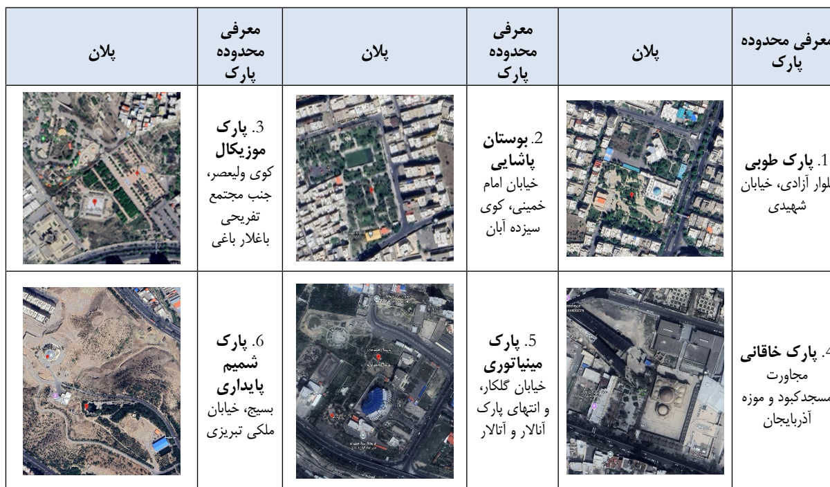
Table 3. Introduction to the statistical population