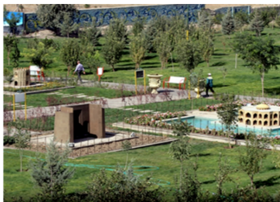
شکل ۴. پارک مینیاتوری تبریز

عدم کاشت گیاهانی که به آب بیشتری نیاز دارند (مانند چمن) برای جلوگیری از اسراف آب و استفاده حداکثری از عناصر طبیعی برای حفظ آن برای نسل‌های آتی (قاعده اتلاف).