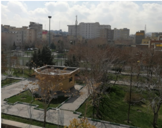
شکل ۳. پارک پاشایی تبریز Figure 3. Pashaei Park, Tabriz

از تمایلات طبیعی آدم‌ها به آب، بوستان، سرسبزی، باغ در جهت گرایش به معنویت می‌توان استفاده کرد که امروزه ارتباط با طبیعت به حداقل رسیده و رویدادهای مذهبی، اجتماعی و فرهنگی به‌ندرت در پارک‌ها برگزار می‌گردد.