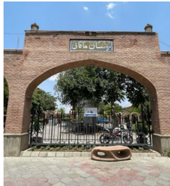
شکل ۵. پارک خاقانی تبریز

توجه بیشتر به ساخت و ساز نسبت به طراحی و ساخت فضاهای سبز و پارک (قاعده اهم و مهم) شکل ۵.