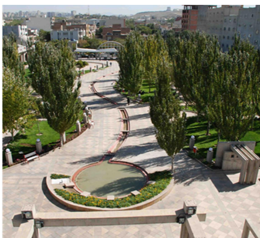
شکل ۲. پارک طوبی تبریز