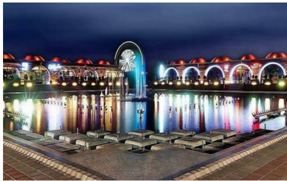
شکل ۶. پارک موزیکال تبریز Figure 6. Musical Park, Tabriz

کمبود ارتباط افراد با طبیعت و دسترسی فیزیکی و بصری به عناصر طبیعی (نشاط و شادی حقیقی) شکل ع